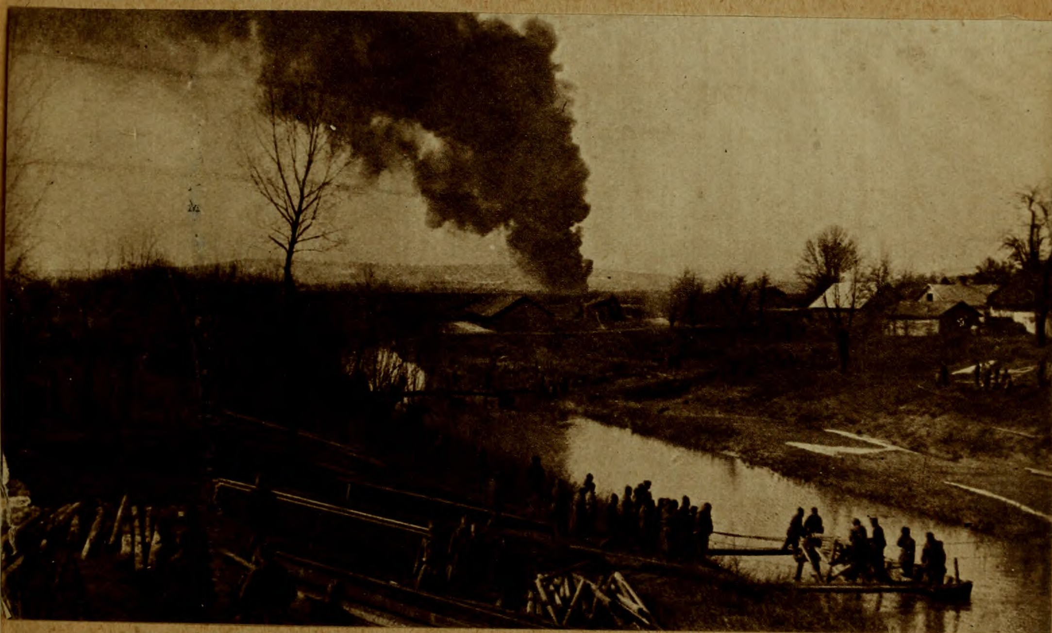
Взорванные форты въ Перемышлѣ. Взрывъ фортовъ въ Перемышлѣ передъ сдачей его русскимъ.